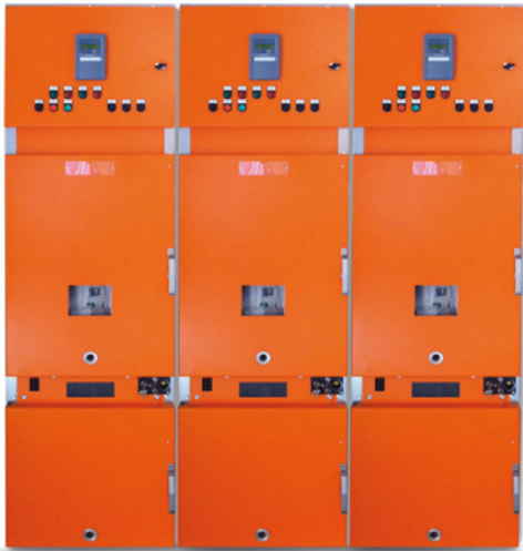
SYSciad switchboard Quadro SYSciad Tableau SYSciad